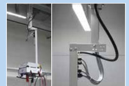
Die Spezialaufhängung mit integrierter Stromführung gewährleistet die gerade Montage der E-BOX.

erstem 5 m-Kabel und CE-Konformitätserklärung ausgeliefert