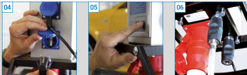
04 Idealer Abstand der Steckdosen für leichte Zugänglichkeit.