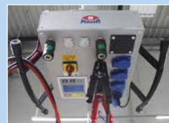
Hebebühnensteuerung, Energieversorgung, Druckluft und Datensteckdose auf der Unterseite platziert.