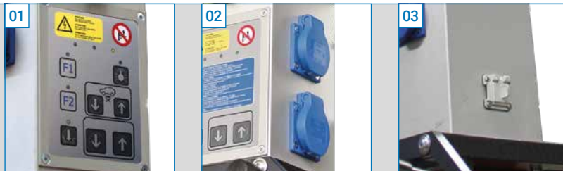
01 Integrierte Hebebühnensteuerung (Option)